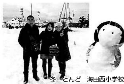
冬・とんど 海田西小学校