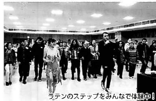
ラテンのステップをみんなで体験中!!