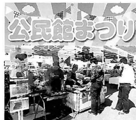
海田公民館祭り・東公民館祭り・海田きん祭より ん祭・海田市祭りに、ペルー・ブラジル料理の店 を出しました。地元のお祭りのお馴染みの味にな りつつあります！