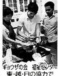
キョウガの会 福祉センター 東・越・日の協力で 中国キョウガをつくります！