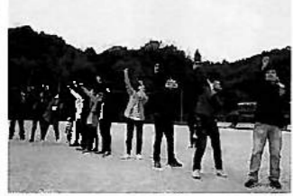
紙飛行機大会 海田総合公園