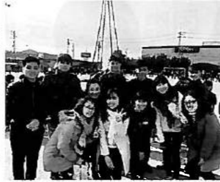
とんど 海田西小学校